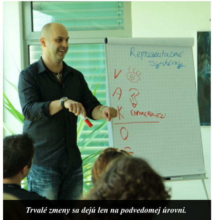
Trvalé zmeny sa dejú len na podvedomej úrovni.

V cudzojazyčných knihách o osobnom raste som stále narážal na tú „tajuplnú“ skratku NLP. Šiel som teda na web - objednal som si knihu o NLP s cvičeniami a „vyrazilo mi to dekel“. Bol som ohúrený, ako rýchlo som si zrazu